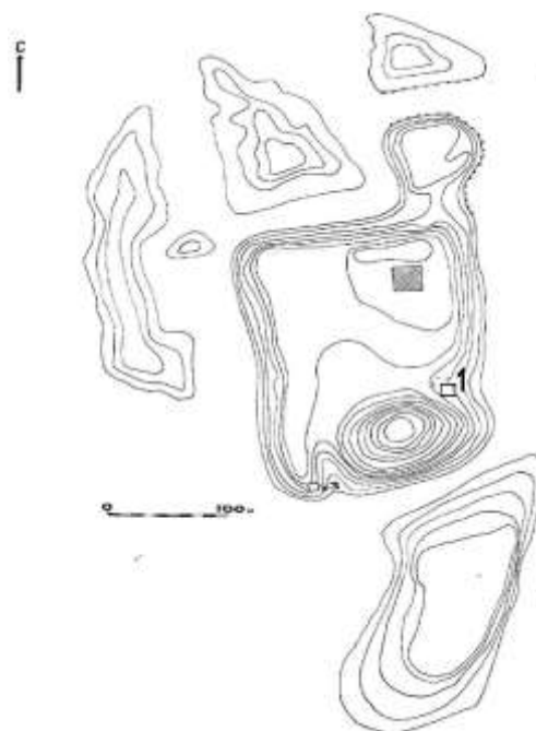
1-расм. Қалиятепа ёдгорлигининг космик сурати ва топографик режаси.

Қазув ишлари Қалиятепа ёдгорлигининг жануби-шарқий томонида олиб борилди. Бу жой шаҳарга кириш қисмининг дарвоза ўрни ҳисобланади. Айнан дарвозадан киришдаги чап томон буржи мудофааси тизимини ўрганишни мақсад қилдик.