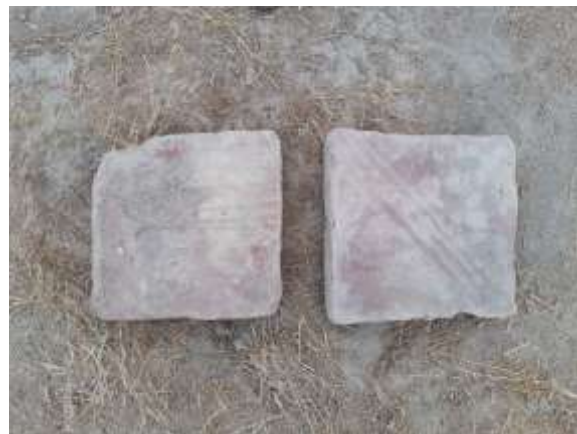
2-расм. Қазув жараёнларида.

қисмида тахминан 30-35 см қазилгандан сўнг қайд этилди (3-расм). Бундай қурилишда фойдаланилган пишиқ ғиштлар Кўк равот ёдгорлигида ҳам қайд этилган. Бу ёдгорлик Қалиятепадан 7-8 км шимолда, Ўрдадан 15-16 км шарқда жойлашган. Тадқиқотчилар томонидан унинг усти ва ён атрофларидан IX-X, XI-XII асрларга оид сопол идиш парчалари, 21x21x4 см қолипдаги сомонийлар даври пишиқ ғишлари йиғиб олинган.