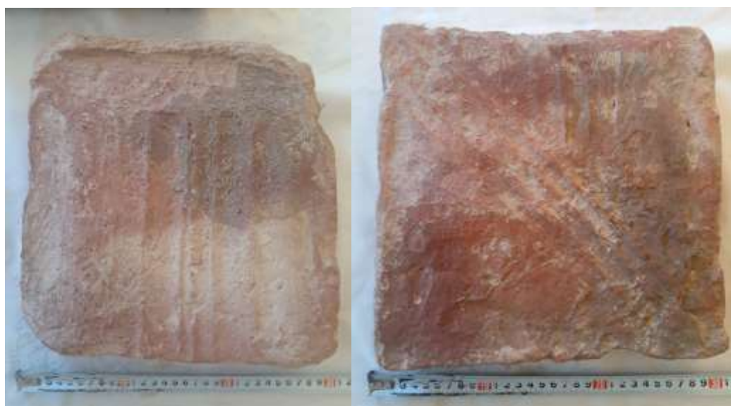
3-расм. Пишиқ ғишт ва ундаги бармоқ излари.

қисмида тахминан 30-35 см қазилгандан сўнг қайд этилди (3-расм). Бундай қурилишда фойдаланилган пишиқ ғиштлар Кўк равот ёдгорлигида ҳам қайд этилган. Бу ёдгорлик Қалиятепадан 7-8 км шимолда, Ўрдадан 15-16 км шарқда жойлашган. Тадқиқотчилар томонидан унинг усти ва ён атрофларидан IX-X, XI-XII асрларга оид сопол идиш парчалари, 21x21x4 см қолипдаги сомонийлар даври пишиқ ғишлари йиғиб олинган.