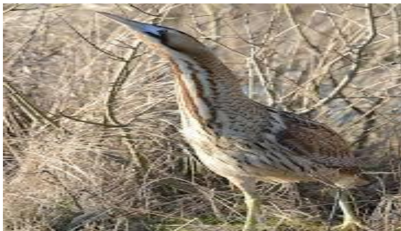
1-rasm. Botaurus stellaris ning olingan fotosurati.

Tarqalishi. Portugaliya sharqidan Yaponiya va Saxalingacha bo'lgan joylarda uchraydigan zotlar. Janubiy yarimsharda Shimoliy-G'arbiy Afrikadan Eron, Afg'oniston va Koreyagacha tarqaladi. Buyuk achchiqning yana bir kichik turi Afrikaning janubiy qismlarida yashaydi. Achchiqlar O'rta er dengizi, Kavkaz, Shimoliy Hindiston, Birma va Janubiy-Sharqiy Xitoyda qishlaydi(2-rasm). Yevropaning ba'zi qismlarida achchiq qish uchun uchib ketmaydi, lekin uyalash joyida qoladi va bahorgacha xavfsiz tarzda omon qoladi. Biroq, qattiq qishda, barcha suv omborlari muzlaganda, ular nobud bo'lishadi.